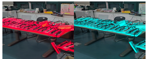
그림 2. 바닥형 보행신호등 보조장치 시제품 Fig. 2. Prototype of floor-type pedestrian signal assist device

본 연구를 통해 개발한 바닥신호등은 그림 2와 같이 485 포트당 64개, 총 128개의 표출부를 연결하여 실내에서 2주 이상 운영 안정성, 등화 표출 등 기능검사를 진행했다.